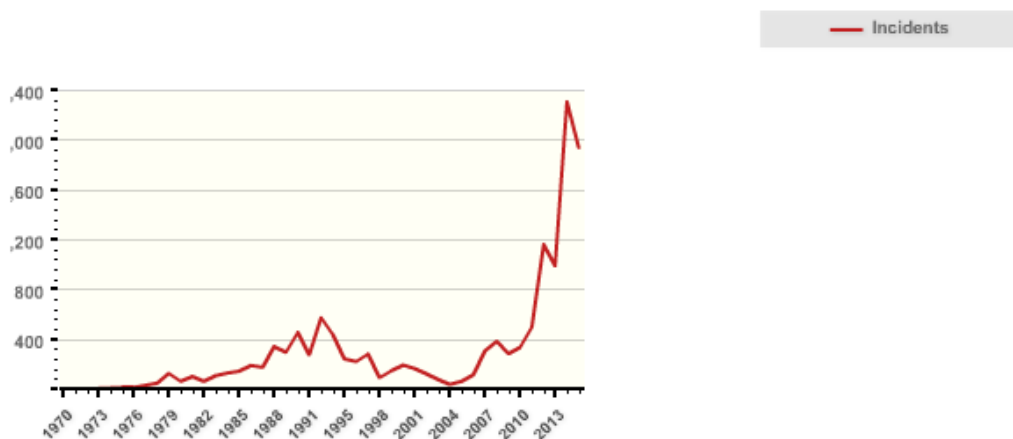
Gráfico 1. Incidentes terroristas registrados en la región de África Subsahariana

Si observamos los datos presentados por el National Consortium for the Study of Terrorism and Responses to Terrorism de la Universidad de Maryland en el Global Terrorism Database , en el año 2001 se habían registrado en África subsahariana un total de 119 incidentes terroristas, pero a partir del año 2004 el número de incidentes empezó a crecer, alcanzando el punto más alto en el año 2014, con casi 2.400 incidentes registrados (véase gráfico 1).