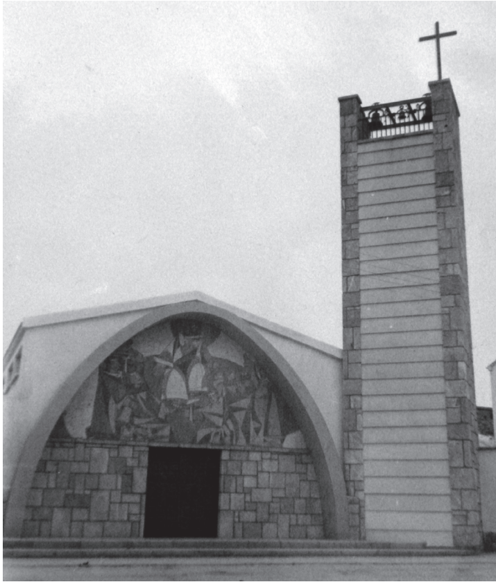
Fig. 6. Alfonso Bartolomé, Mosaico de fachada, 1968. Piedra. AMLA.