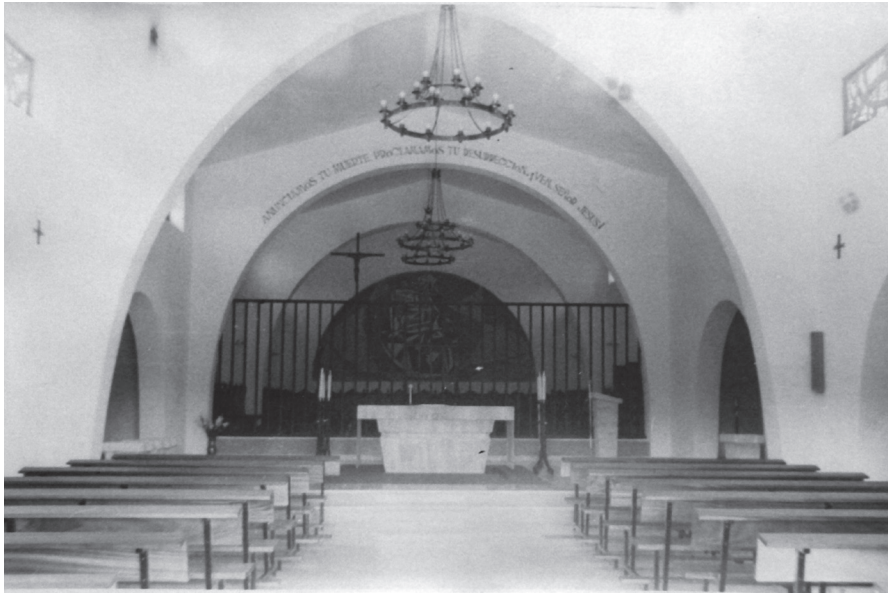
Fig. 3. Interior de la iglesia.

liturgia eucarística en caracteres mayúsculos, una por cada cara, rotulados ya en castellano adoptando el uso de las lenguas vernáculas. Mientras que del lado del coro aparece la invitación al trisagio, «Aclamamos tu nombre cantando: Santo, Santo, Santo...», a la vista de la asamblea laical se incorporó la frase «Anunciamos tu muerte, proclamamos tu resurrección. ¡Ven, Señor Jesús!» de la aclamación memorial. (fig. 3).