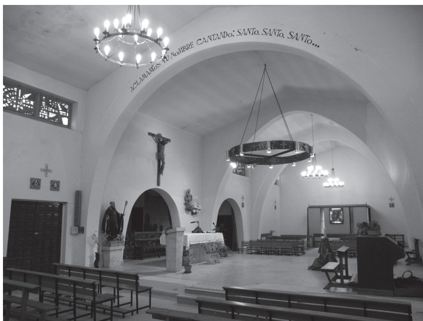
Fig. 4. Interior de la iglesia en 2017.

original únicamente contemplaba en el apartado de las artes plásticas la adopción de vidrieras artísticas, que finalmente fueron desestimadas y sustituidas por mosaicos de mayor contención. En el momento de la ejecución del templo fue preponderante la sobriedad, tomada como criterio deliberado y no condicionada de forma exclusiva por las limitaciones presupuestarias. Efectivamente, una de las notas características de la arquitectura religiosa de la época era este tipo de despojamiento. De acuerdo con este criterio, la belleza no estaba reñida con la sobriedad ni con la sencillez en la comprensión del espacio, sino que más bien éstos la hacían posible. La nobleza, la desnudez y la simplicidad se complementaron con los recursos estéticos para hacer posible la sugerencia y el simbolismo como principal criterio artístico en la nueva arquitectura religiosa. Siguiendo el sendero trazado, la iglesia hizo de la luz y el color blanco sus principales iconos estéticos, aderezados únicamente por el color de los rayos de luz que atravesaban las vidrieras y la tenue policromía del mosaico interior, como veremos. (fig. 4).