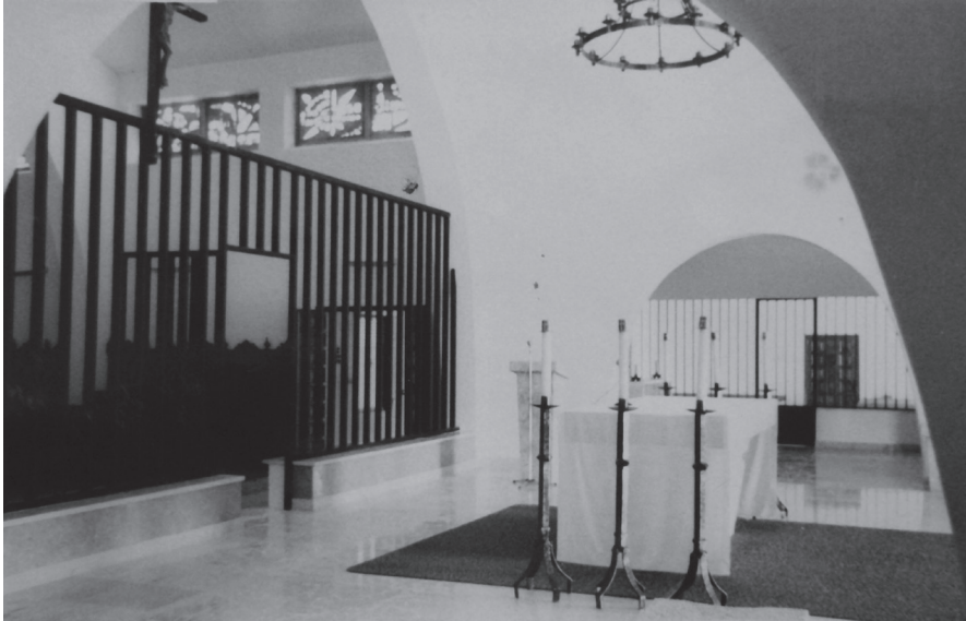
Fig. 2. Presbiterio y coro de la iglesia. AMLA. Foto sin clasificar (s/c)

que en la ejecución final su trazado superior era recto, incorporando en su parte central una puerta que permitía el paso al presbiterio. (fig. 2).