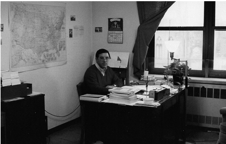
En el despacho como Post Doctoral Training in Sociological Research , en el Sociology and Anthropology Department . Fordham University . Cursos 1986-1987-1988.