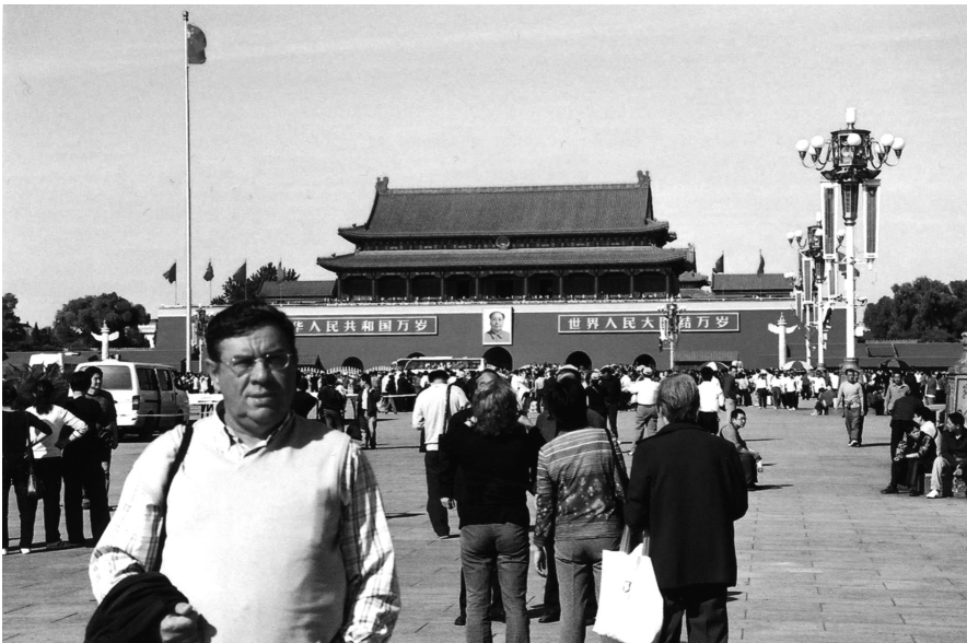
En la Plaza del Pueblo de Pekín con alumnos del Programa Inside China . Octubre 2008.