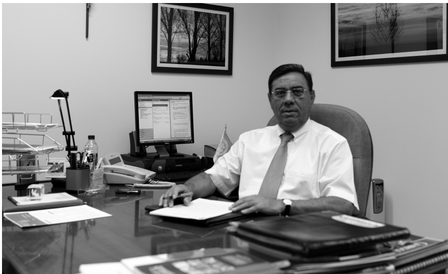
En el despacho de Vice-Rector. Un día cualquiera de trabajo en 2007, 2008, 2009.