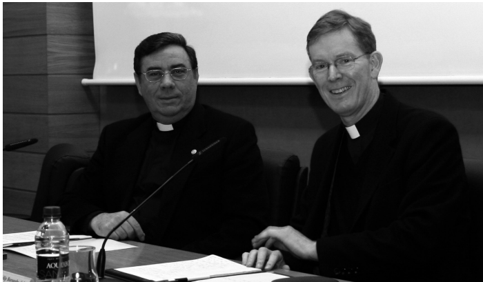
Los Vice-Rectores de Relaciones Internacionales de Comillas y Georgetown trabajando en un convenio de colaboración entre ambas instituciones jesuíticas para el intercambio de estudiantes y profesores. Julio de 2008.