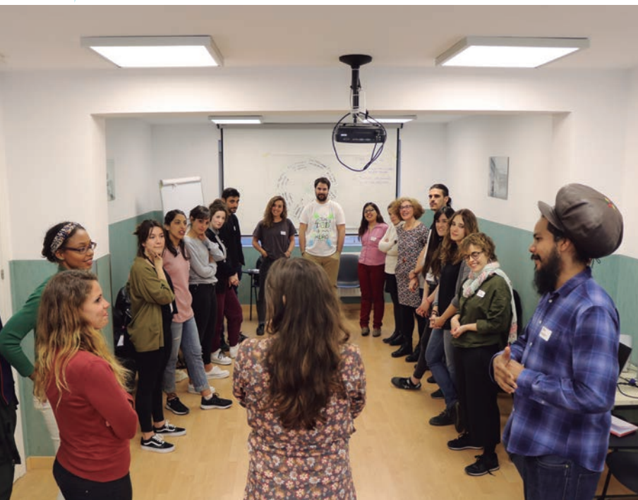
Segundo Encuentro de Buenas Prácticas celebrado en 2019 en Madrid, compartiendo iniciativas educativas y comunitarias para construir ciudadanía global

tando la transformación personal y social. Es a través de la sistematización de esta metodología que hemos podido identificar las claves para una pedagogía del encuentro con la realidad y con otras personas, que lleva a la imaginación de otros mundos posibles y, en consecuencia, a la acción comprometida. ¿Cuáles son las condiciones adecuadas para que estos encuentros sean transformadores? Desde nuestra experiencia con Un mundo en tus manos, hemos identificado varios ingredientes: