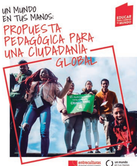
Primera publicación Educación para Cambiar el Mundo

Igualmente, esta propuesta pedagógica recoge las dimensiones que Entreculturas ha ido incorporando en su manera de entender y hacer educación para la ciudadanía global: empatía y acción solidaria, participación y movilización ju-