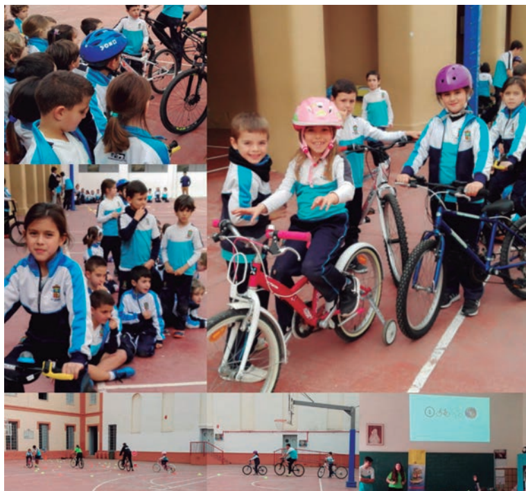
Estudiantes del Colegio San Estanislao de Kotska sensibilizándose sobre el uso de la bicicleta como medio de transporte

La educación tiene el desafío de evolucionar para dar respuesta a los constantes cambios globales que enfrentamos. El mundo nos reta a reaccionar y encontrar alternativas que garanticen una vida digna y sostenible para todas las personas y para el planeta; desarrollar en los estudiantes una identificación con una ciudadanía activa y comprometida con estos desafíos y que tengan la disposición de buscar la transformación de un mundo más justo es una tarea constante que los centros educativos y profesorado deben garantizar. Es importante que, desde diferentes espacios, organizaciones, instituciones y personas del sector social y educativo, reflexionemos y debatamos con el objetivo común de construir alternativas que fomenten una educación transformadora.