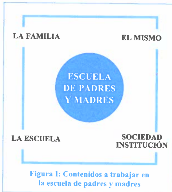
Figura I: Contenidos a trabajar en la escuela de padres y madres

El desarrollo de la escuela de padres y madres se divide en sesiones, partiendo de una estructura metodológica y un contenido teórico previamente elaborado y debidamente estructurado. Los contenidos aparecen interrelacionados, pues como apreciamos en la figura I, los ambientes que configuran el contenido teórico y fundamento de la escuela de padres y madres también se encuentran relacionados entre sí. Si nos fijamos el niño (El mismo) forma parte de una familia cuyos miembros se relacionan con él, conviven con él y todos ellos (padres, hermanos, ...) juegan un papel en el desarrollo e inserción social del niño, pero también está inmerso en un contexto escolar en el que conviven con compañeros y profesores, los cuales influyen de forma directa, pero no podemos olvidar que el niño forma parte de una sociedad y su realidad es distinta a la realidad de muchos otros niños, y esta le influye e incluso condiciona su inserción social y futuro laboral.