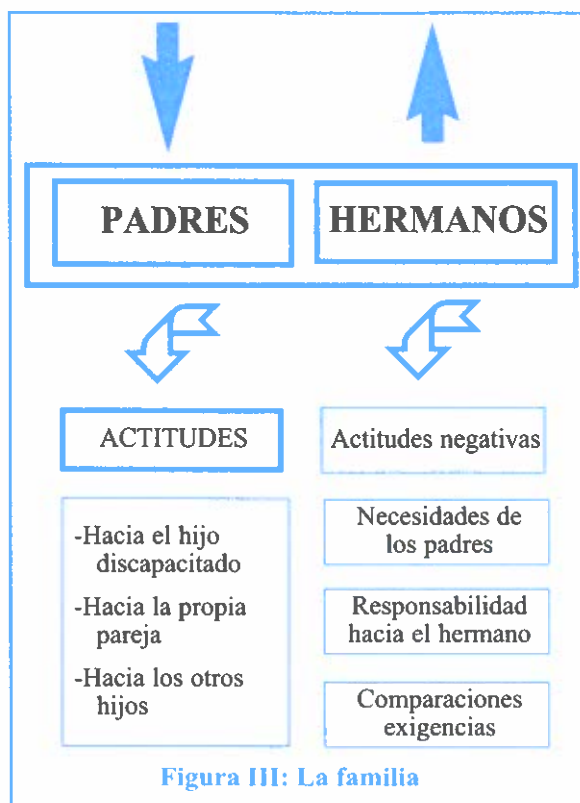
Figura III: La familia

A modo de guión, como propuesta de trabajo en este "ambiente" sugerimos los contenidos de la figura III: