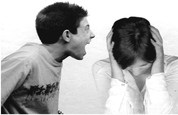
Rev. Mujer Hoy. 29/04/06, Nº. 368