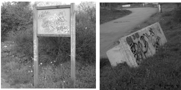
Lunes 24 de abril de 2006