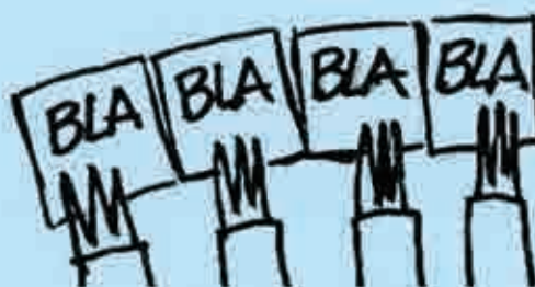
Trabajo en grupos

Una vida suficientemente llena, vital y afectivamente, y la progresiva comprensión de las razones de fondo, les ayudará, mientras van desarrollando el ideal de la madurez afectiva. (Véase a lo indicado en números anteriores acerca de la educación afectiva y moral de niños y adolescentes).