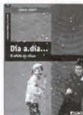
DÍA A DÍA... EL OFICIO DE CRECER ARNAU, V., GRAÓ, B., BARCELONA 2005

Lo primero que nos atrae de este libro es este título tan sugerente: el oficio de crecer. Porque realmente podemos considerar nuestro tránsito evolutivo como un aprendizaje continuo donde, antes de convertirse en experto, hay que ir "quemando etapas".