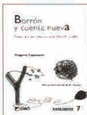
BORRÓN Y CUENTA NUEVA EL OFICIO DE CRECER EN LA ESCUELA DEL SIGLO XXI CASAMAYOR, G., BARCELONA 2005

Aquella escuela de finales de los años cincuenta, la de azotes con la vara en la palma de la mano y también la del inconfundible olor al petróleo de las estufas, se muestra en cuarenta relatos cortos bajo el título de "Borrón y cuenta nueva".