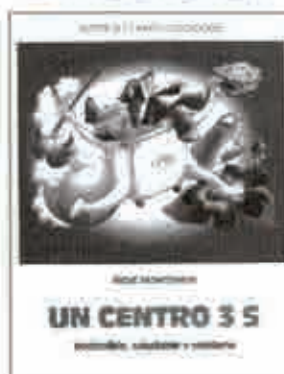
UN CENTRO 3 S CONSEGUIR UN CENTRO 3S DESROSIERS, P. Y TOUSSIGNANT, M., MADRID 2005

Conseguir un centro 3S implica apostar por la búsqueda de respeto y responsabilidad en todos los agentes educativos. Un colegio sostenible, saludable y solidario, lo es cuando respeta el entorno, cuando la conservación de la salud forma parte de su proyecto educativo y cuando hacer el bien y ayudar a los demás es un objetivo prioritario.