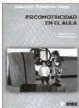
PSICOMOTRICIDAD EN EL AULA DESROSIERS, P. Y TOUSSIGNANT, M., ZARAGOZA 2005

Dirigida a profesores de Educación Infantil y Educación Primaria, esta obra pretende ayudar a integrar la actividad física de los niños en el día a día del niño en el aula.