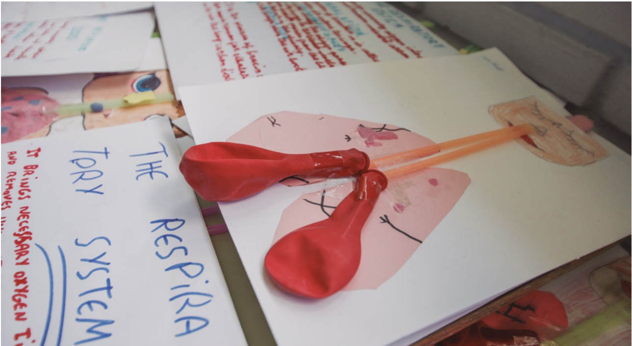
Proyecto de Natural Science 'Modelo de pulmón'

inclinados en la pared, con el fin de que los tapones caigan en ella. El objetivo es que los alumnos cuenten los tapones que les indique el número de las tarjetas y los introduzcan por los rollos de papel. Los tapones caerán en la cubeta y los alumnos podrán contar y ver el resultado de la suma de los tapones.