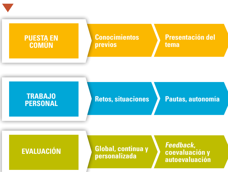
Metodología de Educación Primaria

En el área de Lengua se plantea la actividad denominada ortografía a medida cuyo objetivo es trabajar la ortografía de manera personalizada. Partiendo de la revisión de las faltas en los exámenes y trabajos, se registra en una tabla los errores de cada alumno. Esto permite trabajar cada semana un conflicto, por ejemplo, la b/v, de la siguiente manera. Los alumnos con problemas generalizados como dislexia o disortografía o aquellos que cometen faltas abundantes, realizan ejercicios visuales partiendo de una serie de ilustraciones que asocian las letras que confunden a personajes animados. Con este sistema, el alumno debe recordar cómo se representa esa palabra para, en función de qué personaje aparezca interactuando con ella, determinar con qué letra