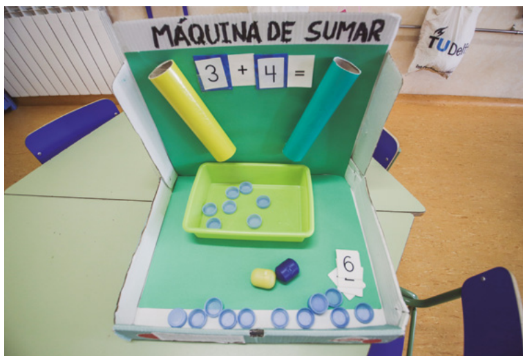
▲ Máquina de sumar