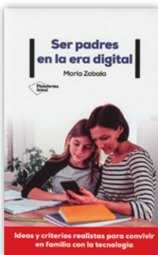
PFFES Plataforma Editorial, 2021 Madrid, 264 páginas

No se trata, por tanto, de una publicación de carácter teórico sobre evaluación de la práctica educativa ni pretende tampoco ofrecer un modelo completo o cerrado, sino más bien de poner a disposición de quienes se acerquen a sus páginas un conjunto de ideas y propuestas basadas en su experiencia a lo largo de los años, confiando en que ayude en alguna medida a valorar y mejorar los procesos educativos que se pongan en marcha en los centros.