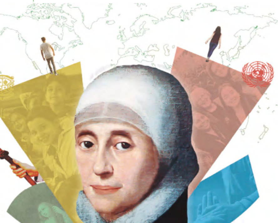
▲ Cartel elaborado por el Colegio Irlandesas El Soto, Madrid

I am afraid that we may repeat yesterday's answers to tomorrow's problems, talk in a way men no longer understand, speak a language that does not speak to the heart of living man.