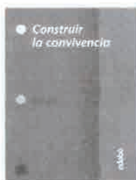
CONSTRUIR LA CONVIVENCIA ORTEGA, R. Y DEL REY, R. EDERÉ, BARCELONA, 2004

El término convivir hace mención a "vivir en compañía". En su definición más estricta se limita a la dimensión familiar; ahora bien, esta palabra ha mutado a otros espacios convirtiéndose en piedra angular para hallar soluciones a muchas necesidades patentes.