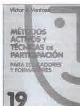
MÉTODOS ACTIVOS Y TÉCNICAS DE PARTICIPACIÓN VENTOSA, V.J. CCS, MADRID, 2004

Con la intención de conjugar teoría, metodología y práctica, esta obra aborda un tema clave en la educación: la desmotivación de alumnos y, por extensión, de profesores.