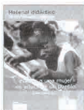
EDUCAR UNA MUJER ES EDUCAR UN PUEBLO LLOPIS, C. (COORD.) INTERED, MADRID, 2005

Con esta publicación, la Fundación InteRed prosigue en su "lucha" por lograr que la sociedad se muestre activa a la hora de reflexionar y debatir sobre el sistema sexo-género vigente. En la construcción de las identidades hombre-mujer existen profundas desigualdades asociadas al ejercicio de comportamientos desproporcionados e injustos. Los estereotipos y los valores existentes en la sociedad actual, ejercen de inhibidores a la hora de lograr el equilibrio en la relación, de igual a igual, entre el hombre y la mujer. Sobre esto, la escuela tiene mucho que decir y hacer. Se aprende a ser hombre y a ser mujer y, ante todo, se aprende a ser equitativo. La equidad supone partir de las diferencias entre hombres y mujeres para lograr la igualdad de oportunidades.