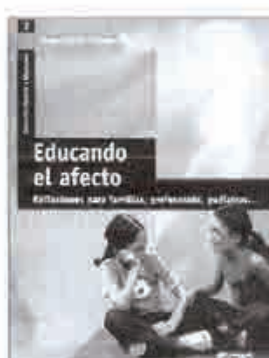
EDUCANDO EL AFECTO. REFLEXIONES PARA FAMILIAS HORNO GOICOEHEA, P. GRAÓ, BARCELONA, 2004

El afecto forma parte de la dimensión más básica del desarrollo humano. Somos seres sociales y en nuestra forma de entender la vida habita nuestra forma de vincularnos y relacionarnos. El afecto se educa, se alimenta, pero también se destruye y se daña.