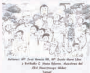
Educar para la solidaridad

El programa ocupa 797 Kb. Uno de los requisitos de este programa es que necesita tarjeta de sonido, puesto que algunas de las actividades son de carácter musical.