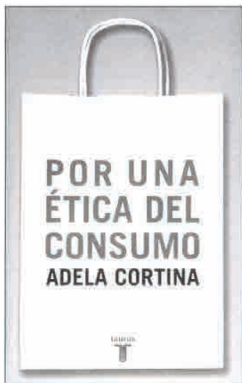
CORTINA, A., Por una ética del consumo , Taurus, Madrid, 2002.

No resulta fácil desprenderse del (o de los) condicionamientos a los que día tras día estamos expuestos. Sin obviar la dosis genética correspondiente, nuestra personalidad está a merced de las épocas y de los tiempos, de los decires y de los sentires, del ambiente. Las personas añoramos algo más que el "simple" ser. Afianzamos nuestra personalidad y procuramos diferenciarnos del vecino con un plus de calidad (muy frecuentemente confundida con cantidad). Tener más y mejor. ¿Por qué? ¿Para qué?