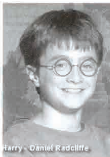
Harry - Daniel Radcliffe

Un acercamiento al mundo de Harry Potter que ofrece preguntas “amables” a padres y educadores.