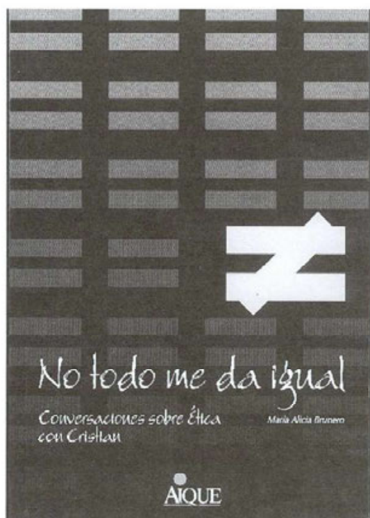
BRUNERO, M a A., No todo me da igual. Conversaciones sobre ética con Cristian , Aique, Argentina, 1999.

"Para escribir un libro nuevo hay que olvidarse de todos los otros libros, después de haberlos leído todos".