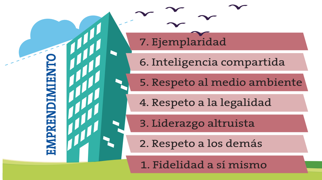
Figura 2. SIETE CLAVES ÉTICAS PARA EMPREDEDORES

Los que sí han sido verdaderos emprendedores son los autores de cuyas citas he partido para reflexionar, brevemente, sobre algunas de estas claves éticas que siempre deben acompañar a un emprendedor. Nada más lejos de mi intención que el tratar de “marcar” estas siete como las únicas y espero que cada uno de los que se acerquen a este artículo aporten en su reflexión alguna de las que, por olvido o falta de espacio, he dejado de mencionar (figura 2).