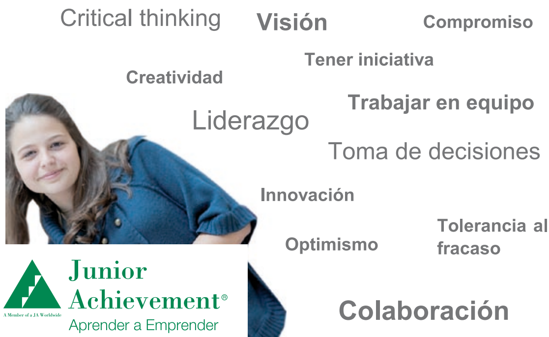
Figura 2. ¿QUÉ DEMANDAN LAS EMPRESAS?

En estudios realizados en Estados Unidos, a través de encuestas a más de 1.100 profesionales preguntados sobre los recién contratados, se desprende que el 79% opinan que no están suficientemente preparados para desempeñar su empleo, el 56% opinan que no tienen life skills habilidades como automotivación, comunicación o capacidad de colaboración, el 47% opina que les falta sentido de la profesionalidad y el 42% identificaba que no quieren o no pueden aprender, sólo el 30% se queja de que no tienen habilidades académicas. En el mismo estudio se identificaban dichas habilidades como los factores clave para el éxito en el trabajo.