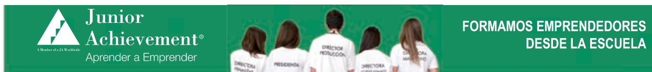
Figura 3. METODOLOGÍA JA