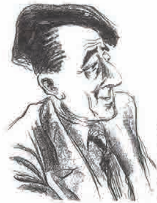
El País, 20 - 5 - 00

La forja de un rebelde , Plaza Janés, Barcelona, 1985.