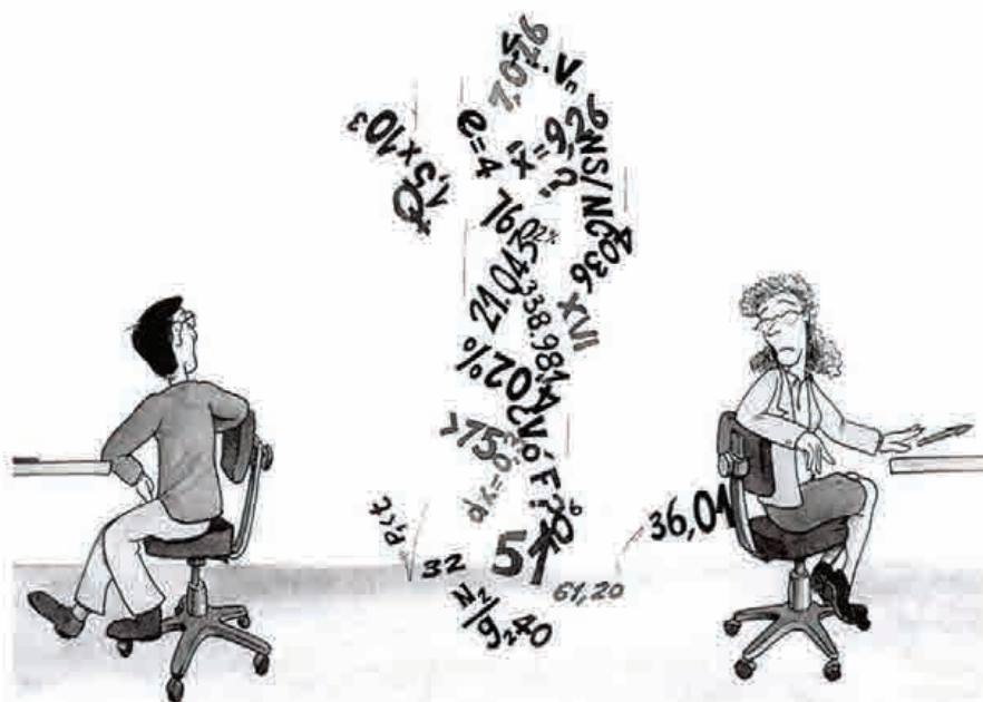
LLUVIA DE DATOS

Es un escrito que sistemáticamente da cuenta, en su contexto, de todos los datos que se han obtenido en la evaluación, haciéndose también eco de las conclusiones a las que han llegado y de las pro-