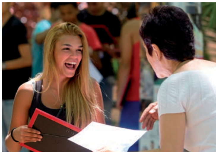
Entrega de diplomas 2013.