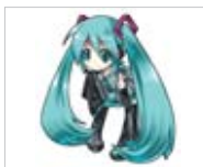
World is Mine (El mundo es mío) (Hatsune Miku)

Quisiera ser la princesa que siempre vas a amar. Sin dudar debes saber de corazón cómo debe ser.