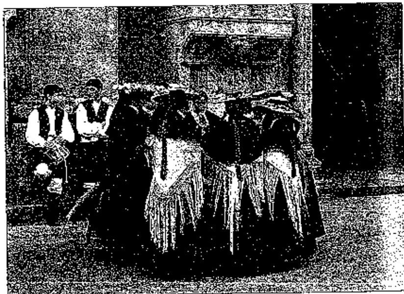
Muchas veces, dentro de un mismo grupo cultural y folclórico, las chicas y los chicos adquieren espontáneamente o por costumbre papeles diferentes

Sin embargo, a la hora de buscar causas, uno tiende a caer en el simplismo o a tirar por la vía fácil. Y desde luego, es más sencillo decir: la coeducación es la causa de todos los males de la escuela que pararse antes a analizar si la coeducación está funcionando como tal (atención a la diversidad y a los rasgos distintos) y no como una simple escuela mixta (juntos, pero con un claro predominio de modelo