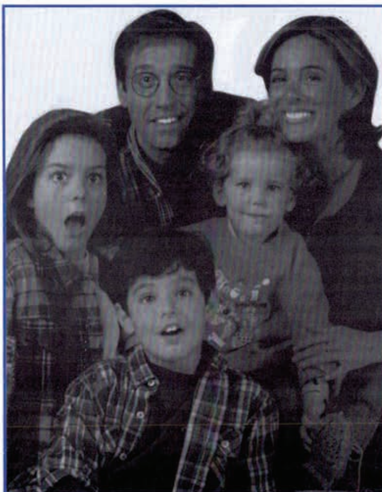
Algunos de los personajes de la serie televisiva

Aunque no siempre le resulta fácil ejercer de padre y madre a la vez. Sobre todo, teniendo en cuenta las difíciles edades de sus tres hijos: María, una adolescente en plena fiebre adolescente, que sieche celos de las novias de su padre. Chechu, un niño de diez años, muy simpático, travieso, gamberrete y respondón y Anita, la más pequeña, una niña de tres años, a la que todavía hay que acompañar a hacer pis.