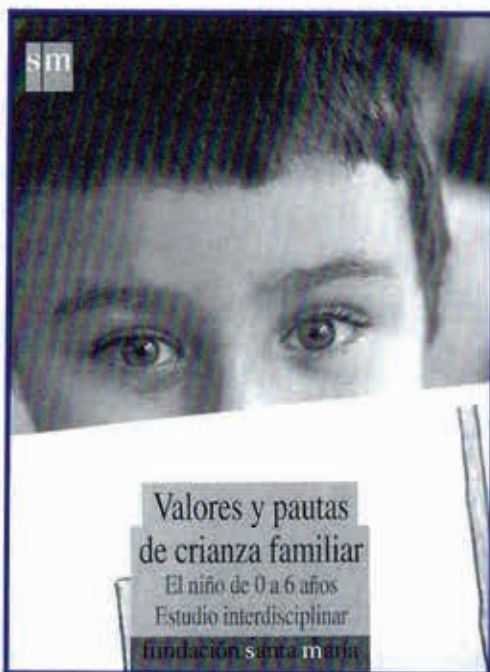
«Valores y pautas de crianza familiar» Editado por la Fundación Santa María y comercializado por CESMA, S.A. Aguacate, 43. 28043 Madrid

• A continuación, y según la encuesta, figuran los padres – sobre todo,