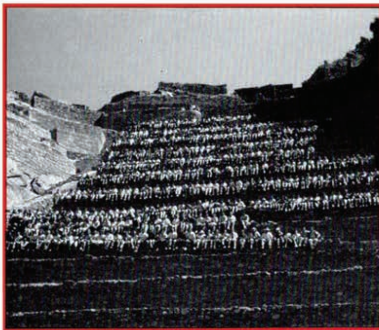
Grupo de expedicionarios al Mundo Inca, 1995 en las ruinas incas de Ollantaytambo

— «Yo era muy tímida y, o te espabilas, o te ahogas: me espabilé»