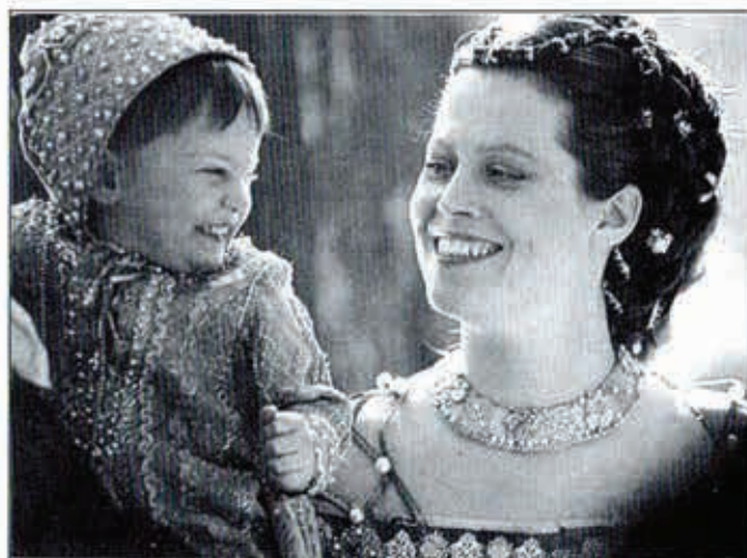
En la película de Ridley Scott, Sigourney interpreta el papel de Isabel la Católica y su hija de dos años, a una enana de la Corte.

El hecho inaudito de que se hubiera declarado independiente del rey de España, las circunstancias novelescas de su vida familiar y el desastroso desarrollo de su expedición a la búsqueda de El Dorado han convertido la figura de Lope de Aguirre en enormemente atractiva para los escritores españoles modernos. Ramón J. Sender, que también dedicó a Hernán Cortés su obra Jubileo en el zócalo , ha escrito una magnífica novela histórica sobre el héroe vasco titulada La aventura equinocial de Lope de Aguirre .