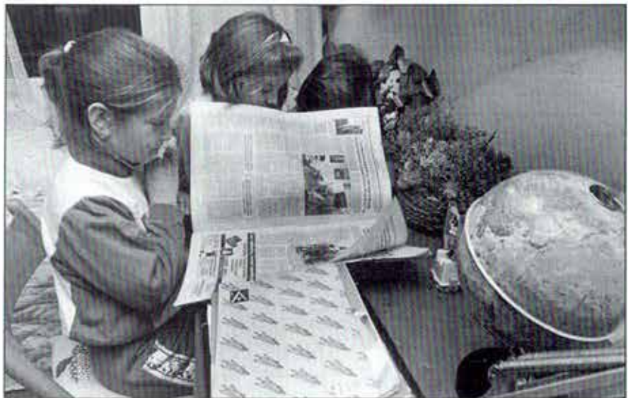
Es importante que el periódico llegue a los niños desde los primeros años escolares

Analizamos el Área correspondiente a "Conocimiento del Medio", Bloque 9.