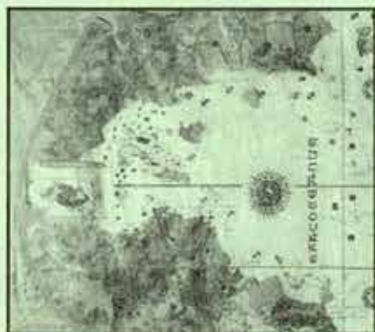
Mapa de Juan de la Cosa: El mundo no es ya como lo había visto Ptolomeo. Los nuevos descubrimientos geográficos propician una visión distinta, cuya primera plasmación gráfica se debe al navegante Juan de la Cosa, que acompañó a Colón en su Segundo Viaje.