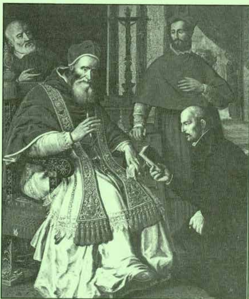
Paulo III aprueba la fundación de una nueva orden religiosa

La Bula Papal «Regimini militantis Ecclesiae» funda una nueva orden religiosa que se denominará Compañía de Jesús. La orden tiene su origen en un grupo de estudiantes de la Universidad de París que decidieron en 1534 asociarse y formular comunitariamente votos de castidad y pobreza y, además, otro especial de peregrinar a Tierra Santa o, en caso de no poder cumplirlo, de someterse a la decisión del Papa para fijar su género de vida apostólica y los lugares donde debiera realizarse. El grupo estaba formado por siete estudiantes, de los cuales cinco eran españoles: Iñigo de Loyola, su líder; Francisco Javier,