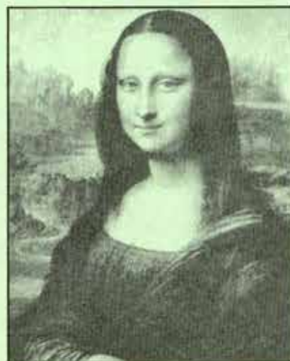
Leonardo da Vinci pinta el retrato de Mona Lisa: La fama del pintor florentino Leonardo da Vinci se ha extendido por toda Italia, después de concluir la monumental pintura de la Sagrada Cena. En la actualidad el polifacético pintor, que alterna su trabajo con el diseño de ingeniosas máquinas, está pintando el retrato de la dama Mona Lisa.