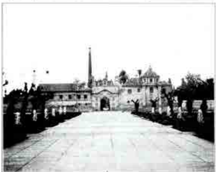
Una Meta en la Expo 92: La tercera etapa de la Vuelta Ciclista a España (foto) fue en la iglesia de San Ciriaco, en el puro centro de la futura Exposición Universal de Sevilla. El acontecimiento deportivo servirá de pequeño ensayo de lo que separará el próximo futuro al recinto de la Feria en materia de aglomeración de masas.

Extremadura fue el primer territorio que en 1981 en España se declaró una comunidad autónoma, en una resolución del presidente de España, Juan Carlos I, que se firmó en Sevilla. Y así es hoy el primer paso.