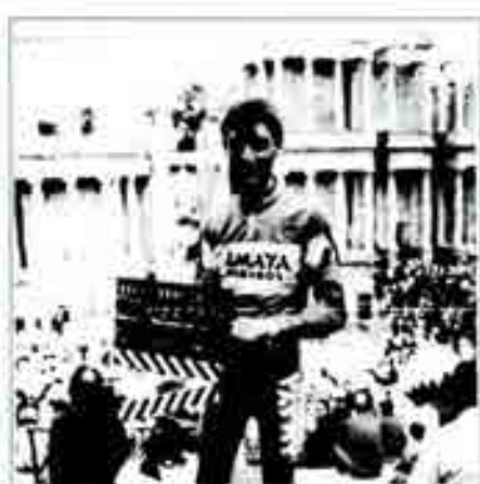
Cuando se publica el libro de ruta de la Vuelta Ciclista a España, se cuenta entre los escritores de la época literaria, porque el autor había alcanzado el 20 de mayo de 1985.