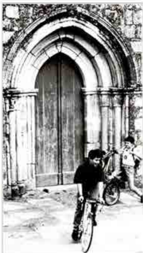
La bicicleta es un símbolo de progreso por sí misma. Una persona cada dos minutos en el mundo utiliza la bicicleta como medio de transporte.

Este ahorro energético, considerado de una manera global, y teniendo en cuenta los problemas ambientales, pero sobre todo, del planeta Tierra, es sin duda una buena razón para querer más a la bicicleta. Al mismo tiempo resulta que los automóviles son el motivo de que en el mundo exista por sí misma una persona cada dos minutos, y sabemos también que los coches son importante motivo de las emisiones contaminantes de gases a la atmósfera, que originan un efecto invernadero como las bombas atómicas y el efecto invernadero. Total, que ante esta situación, la bicicleta se ha convertido para muchos en un símbolo de progreso y futuro. Como todos los otros son tan posibles, y las ventajas no se valían igual por todos, resulta que el Ayuntamiento de Cambridge está considerando el prohibir la circulación de bicicletas por el centro de la ciudad, para evitar