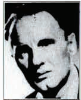
Janos Kadar es el nuevo secretario general del Partido Comunista Húngaro.

Más de mil tanques rusos han tomado las calles de Budapest y han bombardeado y asaltado el edificio del Parlamento donde se había refugiado el gobierno. El primer ministro ha sido hecho pri-