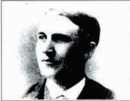
Edison y la lámpara eléctrica incandescente que ataba de patentar