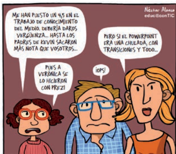
Figura 2. RECOMENDACIONES

A nivel social, los deberes son discriminatorios y generan desigualdad cuando se hace responsable de la instrucción a la familia perteneciente a los grupos socialmente desfavorecidos. Los padres no tienen nivel educativo suficiente para responder a las cuestiones que la escuela plantea y en la mayoría de las ocasiones carecen de recursos suficientes para poder pagar un servicio externo (profesor particular, academia, etcétera), que supla sus carencias culturales y ayude a sus hijos en previsión de su fracaso escolar.