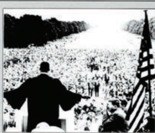
Martin Luther King se dirige a millones de americanos, durante la marcha por la libertad de mayo de 1967

La mayor parte de su obra se conserva en las iglesias y casas de Toledo. En realidad el pintor, cuyo particular estilo no coincidía con los gustos del rey Felipe II, no intentó nunca conquistar el mercado pictórico de la Corte y prefirió entregarse a un trabajo muy personal en la ciudad del Tajo.