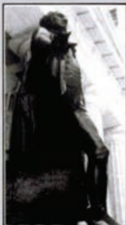
Monumento a Washington erigido en el lugar donde prestó juramento.

El general George Washington, presidente ya del conjunto de los Trece Estados, ha estado presente y ha sido protagonista principal de los acontecimientos que han desembocado en la creación de los Estados Unidos de América. Participó, en primer lugar, en la rebelión contra Inglaterra y fue elegido general en jefe de los ejércitos de las colonias, durante la Guerra de la Independencia. Después su intervención fue también decisiva durante los largos debates de los delega-