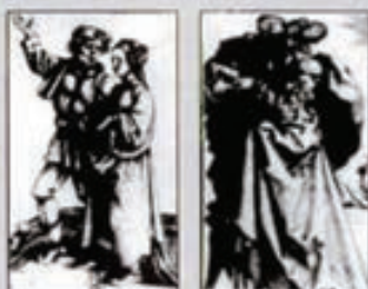
Campesinos y aristócratas.

Las telas eran fundamentalmente de lino y también de lana (eran famosos los paños ingleses), algodón (importado de Oriente) y seda, pero todavía sin una gran variedad ni calidad en los tejidos. Por esta época aparecieron los botones, que sustituyeron a las ataduras. Los zapatos no tenían tacón y se confeccionaban de modo que servían para cualquiera de los pies. No se usaban botas altas. En la segunda mitad de este siglo aparecieron las medias de seda de punto, que sustituyeron a las de tela.