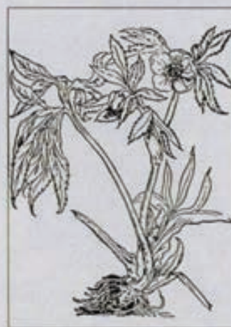
Rosa de Navarra.

El creciente conocimiento del Nuevo Mundo, de África y el Oriente hizo que poco a poco se fueran deshaciendo los mitos sobre extrañas y fantásticas criaturas que habitaban los lugares que nadie había visto. Comienzan a realizarse los grandes inventarios de la Naturaleza, partiendo de las obras de Aristóteles y Teofrasto que habían sido traducidas al latín y enriqueciéndolas con los animales y plantas que continuamente se descubrían.