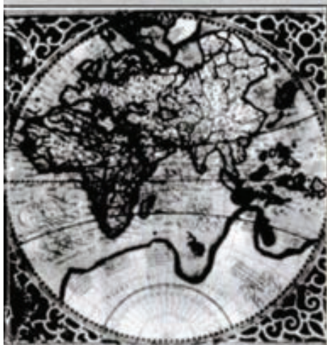
Reproducción de la imagen de la Tierra tras los últimos descubrimientos.