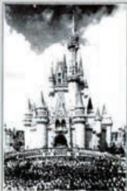
Andersen es el autor de cuentos infantiles más traducidos

Leer, descubrir que la lectura es un placer, que uno se divierte mucho recreando en su cabeza las historias encerradas en los libros es algo muy importante en la vida de