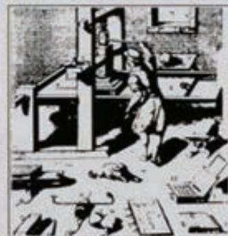
Una imprenta, alrededor de 1607.

Un siglo después de haber sido inventada, la imprenta servía a finales del XVI para eliminar las barreras que obstaculizaban la comunicación entre los hombres. Las ideas, los nuevos inventos, se difundían con rapidez, y el libro se convirtió en el gran instrumento para la difusión del conocimiento. Algunas obras llegaron a tener medio centenar de ediciones en este siglo.