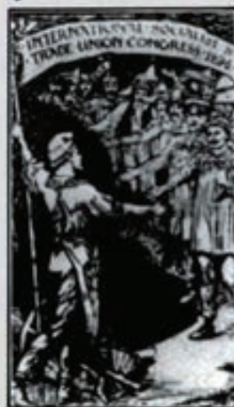
Los sucesos de Chicago en 1886 dieron origen al Primero de Mayo.

La fiesta fue instituida por la Segunda Internacional, que se reunió en París, en 1889. El motivo fueron los tristes sucesos acaecidos en Chicago. El uno de mayo de 1886 se inició en la ciudad norteamericana una huelga general en la que los obreros reivindicaban la jornada laboral de ocho horas. Se produjeron algunos incidentes y varios dirigentes sindicales fueron apresados. Los tribunales juzgaron a cinco y los condenaron a muerte. Meses más tarde la sentencia se eje-