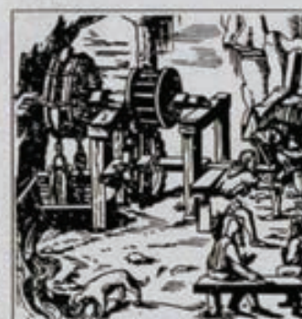
Drainaje de una mina, Agrícola 1555.

La gran historia de las máquinas del siglo XVI está fundamentalmente en los nombres de Arquímedes y Leonardo. En esta época se utilizaban normalmente las palancas, poleas, ruedas dentadas, tornos y comenzó a usarse la carretilla. Aparecieron los primeros tornillos, y los destornilladores, las tuercas y la llave inglesa. Las palas comenzaron a ser de hierro (anteriormente eran de madera) y las máquinas, en general, aumentaron el tamaño al aparecer las primeras producciones industriales a gran escala (minería, metalurgia...).