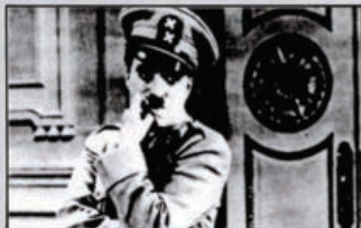
Chaplin en «El gran dictador».

En ellas Chaplin sacaba a relucir toda la experiencia acumulada en sus años de