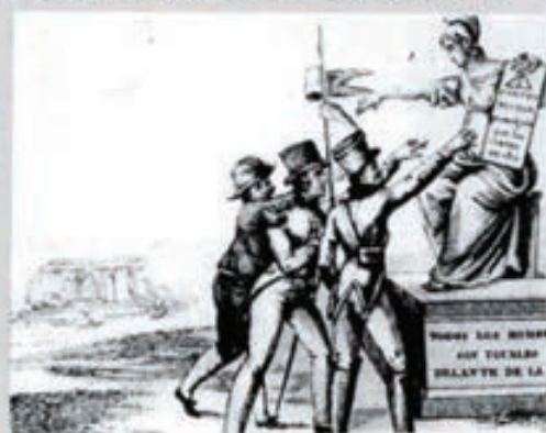
Alegoría de la Constitución de 1812 que se conserva en el Museo Romano de Madrid

La nueva Constitución establece ideas fundamen-