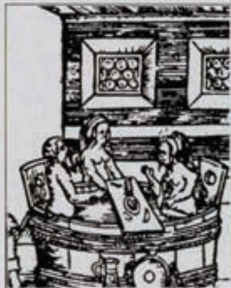
Bañándose en una gran tina, 1586.

El baño era costumbre usual. Se conocía el jabón y los peines. El despojamiento era una práctica corriente. Los barberos cortaban el pelo y arreglaban la barba, que mantenían todos los hombres. Las mujeres solían depilarse las piernas, utilizando unas telas que impregnaban en resina.