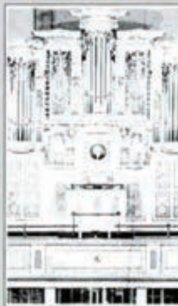
El órgano de Bach en Amstett

La idea de volver a oír la composición en el centenario de su estreno se le ocurrió al joven músico Félix Mendelssohn, ayudado por su compatriota alemán Eduard Devrient. El éxito del concierto ha sido total. El público asistió sorprendido y conmovido a una auténtica revelación musical mientras el coro y la orquesta interpretaba la obra injustamente olvidada. Algunos críticos juzgan que nunca nadie ha sido capaz de escribir una música así. Los eruditos se preguntaban con asombro cómo ha sido posible que tal calidad de creación haya podido ser olvidada en el corto espacio de tiempo de un siglo. La conmoción creada ha llevado a los músicos a la búsqueda de cualquier partitura que pudiera encontrarse del compositor redescubierto, pero todo esfuerzo ha resultado inútil; nadie ha sido capaz de encontrar ninguna partitura.