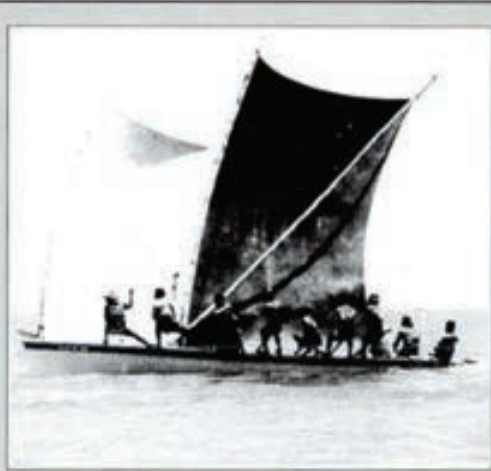
El mar, un patrimonio mundial que todos tenemos la obligación de conservar

funciones domésticas, consideradas secundarias. Pero la mujer debe tener igualdad de derechos en todos los campos: en la vida política, en la profesional, en la vida familiar y en la vida social. La igualdad tiene que ser real, no sólo en teoría y sobre el papel.