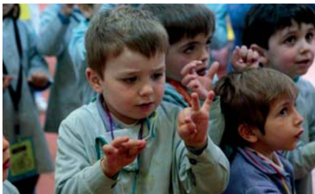
Colegio Cardenal Spínola. Esclavas del Divino Corazón (Madrid).

Interacción (Ramón Flecha. Universidad Autónoma de Barcelona): el aprendizaje se da en interacción; el aprendizaje es, primero social, y después individual. A mayor interacción, mayor aprendizaje; a mayor heterogeneidad en la interacción, mayor aprendizaje. Por ello, todas nuestras metodologías están encaminadas a generar el mayor número de interacciones y que éstas sean lo más heterogéneas posible.