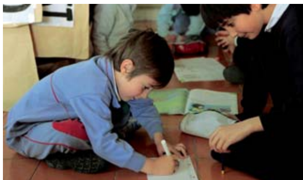
Colegio Cardenal Spínola. Esclavas del Divino Corazón (Madrid).

Inclusión (Asunción Moya. Universidad de Huelva/Ramón Flecha. Universidad Autónoma de Barcelona): no existen alumnos con necesidades educativas especiales sino centros con barreras. La labor de un centro debe ser la de adaptar sus estructuras para que todos los alumnos puedan participar en plenas condiciones de todo el proceso de aprendizaje. Para ello, todos nuestros recursos educativos estarán siempre dentro del aula, siendo éste el espacio ideal y buscado para que todos los alumnos participen de todo. Además, a mayor diversidad en un aula, mayor heterogeneidad de interacciones, y, por tanto, mayor aprendizaje. La inclusión no se mide por el porcentaje de alumnos diversos en un centro, ni por el porcentaje de tiempo que pasan estos en las aulas, pues entendemos que todos juegan todo el juego y todos son tan diferentes como iguales.