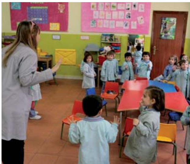
Colegio Cardenal Spínola. Esclavas del Divino Corazón (Madrid).