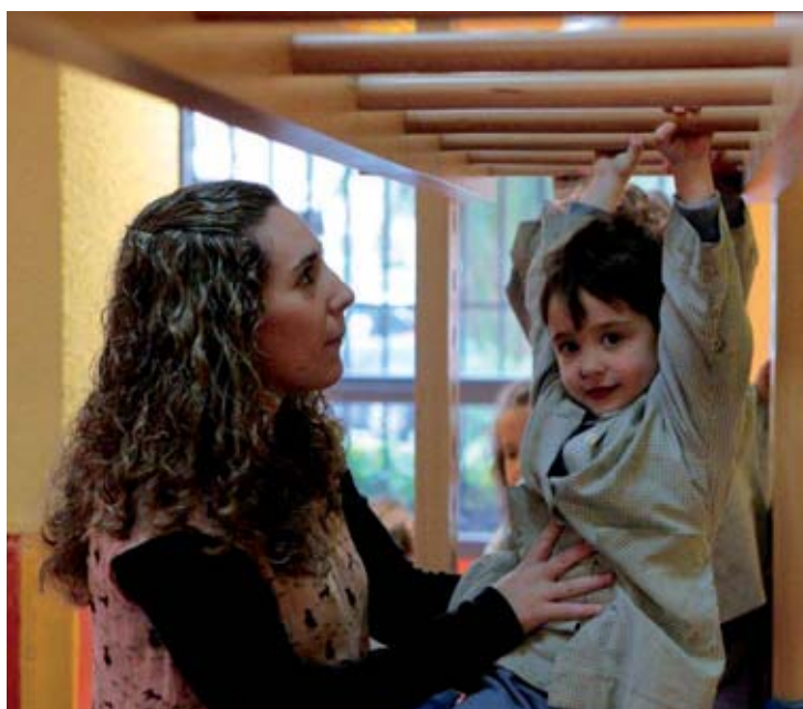
Colegio Cardenal Spínola. Esclavas del Divino Corazón (Madrid).

Toda esta maravillosa experiencia, acompañada de aquellos puntos fuertes que ya lo eran en la etapa (rincones, asambleas, hábitos y rutinas...), no hubiera sido posible sin el apoyo de un equipo directivo formado y comprometido con nuestra propuesta educativa, coherente y trabajador; un departamento de orientación competente, que se realiza dentro de las aulas y codo a codo con el compañero; pero, muy especialmente, nunca hubiera sido posible sin el entusiasmo, la ilusión, el trabajo en equipo, el apoyo mutuo y el formidable esfuerzo que todo el equipo de infantil ha realizado, sin excepción, superando con creces las expectativas y los objetivos que tenían planteados. Profesionales que hoy sacan de sí mismos lo mejor: su creatividad, su capacidad para trabajar alegres, para dar respuesta a las demandas de los alumnos, para soñar una escuela mejor, un mundo mejor..., para hacer realidad el otro sueño, el de Marcelo Spínola. Hoy, nuestros alumnos sienten cómo todo lo que ocurre a su alrededor educa y da forma a su corazón. ■