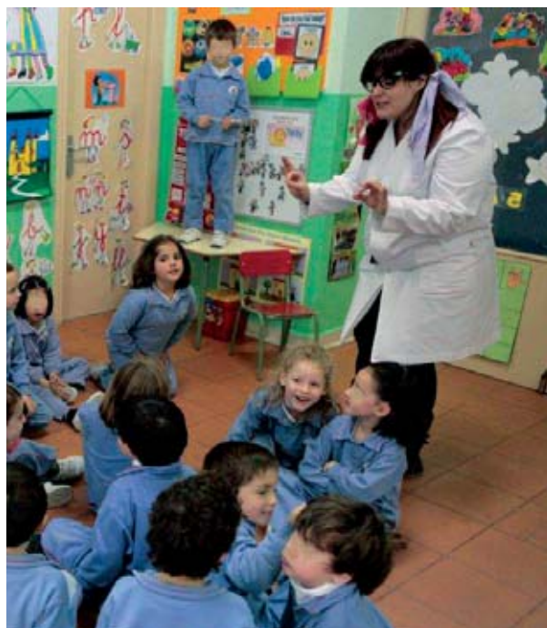
Colegio Cardenal Spínola. Esclavas del Divino Corazón (Madrid).

En la etapa de infantil se han de conjugar más que nunca dos ideas fundamentales en educación: la escuela como una comunidad real de aprendizaje, donde todos los agentes participan, y la estimulación neuronal y sensitiva así como, de las diferentes inteligencias y de la creatividad.