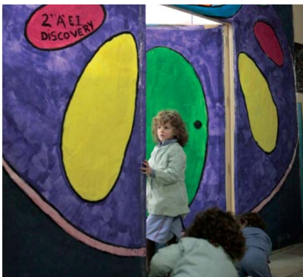
Colegio Cardenal Spínola. Esclavas del Divino Corazón (Madrid).