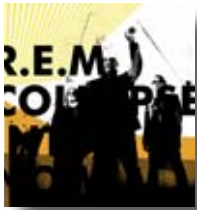
Every day is yours to win (REM)