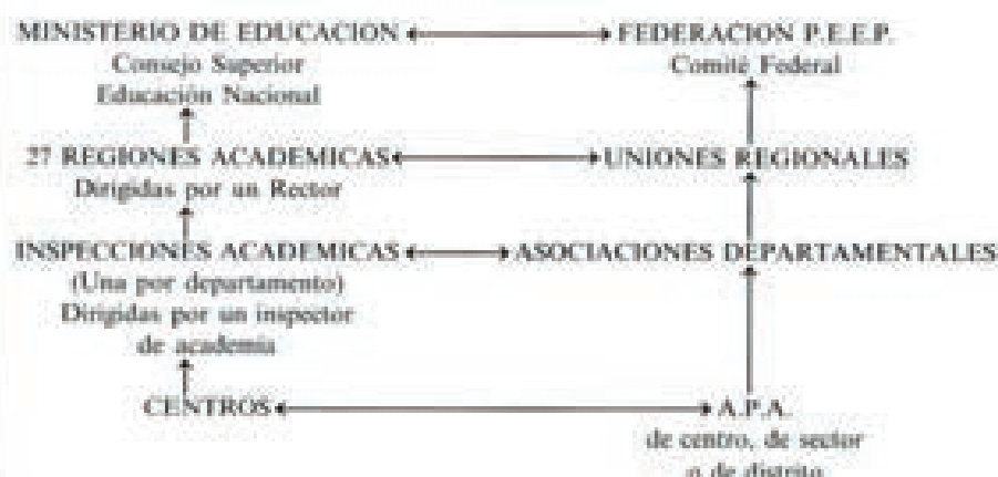
Estructura y representaciones de la P.E.E.P.

(FEDERATION DES PARENTS D'ÉLÈVES DE L'ENSEIGNEMENT PUBLIC: juillet-août 1981 a. 7)