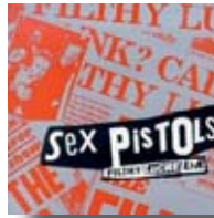
My way (Sex Pistols)