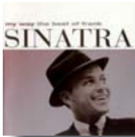
My way (Sinatra, Los Piratas, Calamaro)