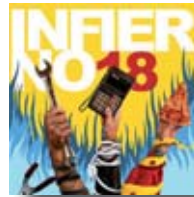
A mi manera (Inferno 18)