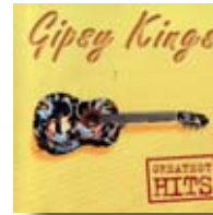
A mi manera (Gipsy Kings)

And now, the end is near, and so I face the final curtain. My friend, I'll say it clear, I'll state my case of which I'm certain.