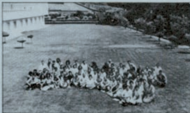
El Pazo de Mariñán será nuevamente el escenario de un seminario sobre comunicación dirigido a profesores que intercambiarán experiencias, en este ocasión, sobre la utilización del vídeo en la escuela.

de la Escuela» y técnicos de imagen de «Voz-TV». Este seminario se enmarca dentro de los cursos de verano que organiza este año la Universidad Internacional «Menéndez Pelayo» en su sede de La Coruña y va dirigido a profesores con experiencia en la utilización del vídeo en las aulas.