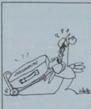
El Documento Nacional de Identidad juvenil solicítase a los 14 años y su vigencia a partir de los 16.

Viajes en avión: Los vuelos «charter» son la modalidad más corriente de viajes en avión a precios rebajados, existiendo algunos especiales para estudiantes. Asimismo, hay una serie de descuentos en vuelos nocturnos, internacionales, de grupos o poseedores del carnet ISIC, de lo que te puedes informar en agencias de viajes, compañías de vuelo y oficinas TIVE, pues esta última cuenta con unos programas de viajes concertados muy interesantes tanto en avión como en tren, autobús o barco.