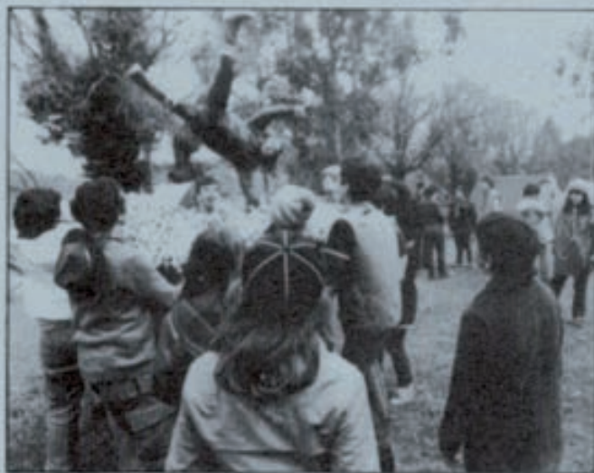
La solidaridad y el compañerismo, dos valores que se refuerzan durante el verano.

actividad más dentro del programa «Conoce Nuestros Parques Nacionales». El Parque Nacional de Covadonga y Dunas de S. Jacinto (Pórtugal), el Parque Nacional de Doñana (Huelva) y Geres (Portugal) y el Parque Nacional de Ordesa y Monte Perdido (Huesca), serán los escenarios de esta actividad. Consiste en una serie de trabajos encaminados a adquirir un sentimiento de responsabilidad y compromiso para la conservación y protección de los Parques.