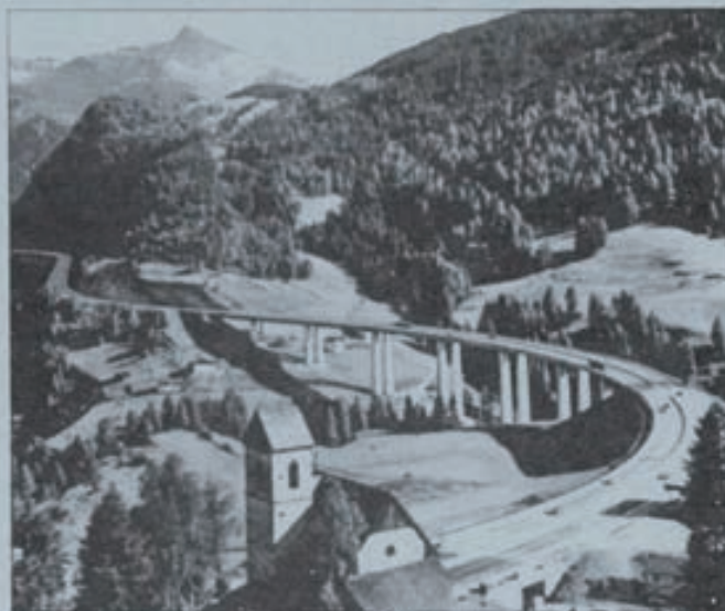
La Comunidad Económica Europea tiene a unificar las normas relativas a la documentación necesaria para pasar, sin sobresaltos, las fronteras.