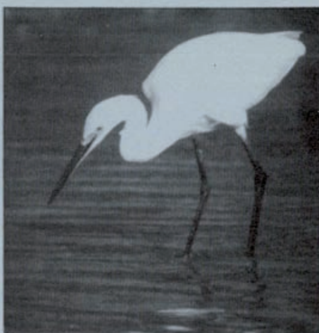
Los Parques Nacionales son los lugares seleccionados para los encuentros y el escenario de los campos de trabajo.