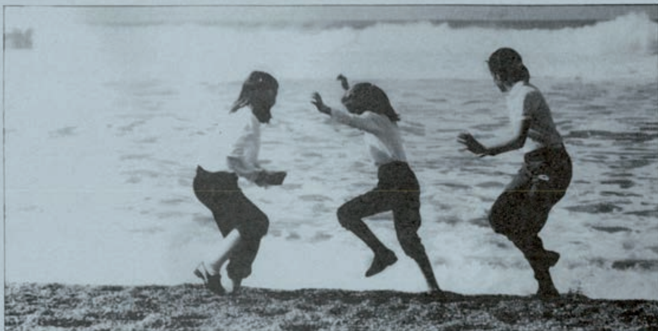
Cada día son más los jóvenes que planean sus propias vacaciones. Diversos organismos e instituciones podrán facilitarles este trabajo.