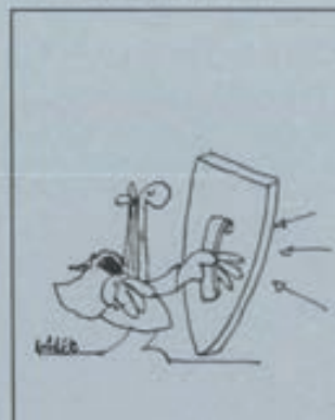
Desde el 15 de junio quedó suprimido el sistema de visados para desplazados de la Seguridad Social. Basta con viajar con la tarjeta de asistencia.