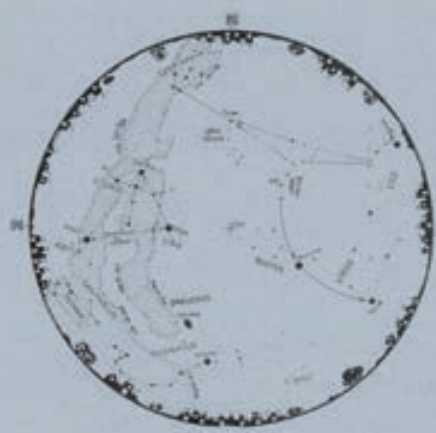
El mapa del cielo durante el mes de julio