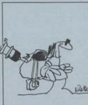
Varios países de África, Asia o Sudamérica exigen el Certificado Internacional de Vacunación.