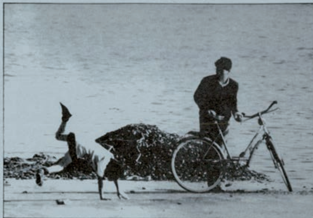
Los Encuentros de Cabueñes de este verano tienen como motivo central la conmemoración del Año Europeo del Medio Ambiente.

Una forma económica de conocer un país y aprender su idioma