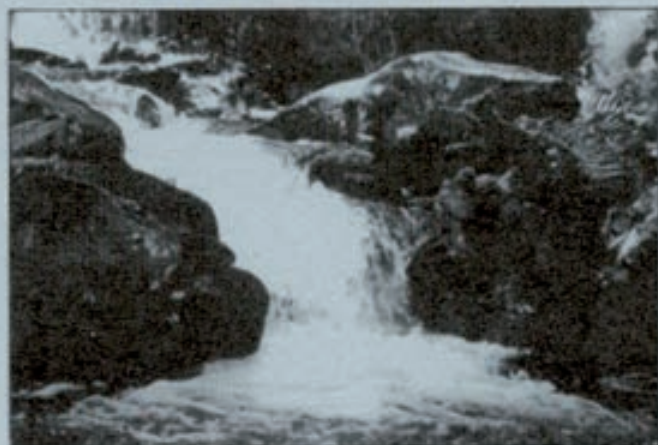
Descubrir un río, toda una aventura.

En siglos pasados, las cañadas por las que transcurrían los rebaños trashumantes, constituían importantes líneas de comunicación entre los distintos pueblos. Estas cañadas que discurrían por la orografía nacional sin apenas modificarla, son hoy reliquias de un pasado que se ha visto superado por carreteras y vías ferroviarias. No obstante, nos permiten en la actualidad acercarnos a un entorno rural lleno de tradiciones y con una forma de vida muy distinta a la de las ciudades.