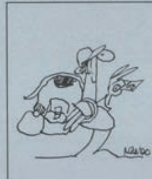
Hay muchas formas de ahorrarse unos días utilizando tarjetas en transportes públicos.