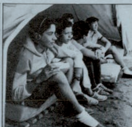
La mayoría de las actividades de esta oferta para el verano están relacionadas con la naturaleza.