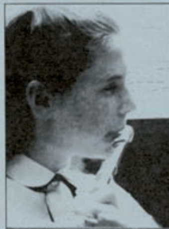
En verano se celebrarán varios cursos y encuentros de música y teatro para jóvenes.

Encuentro Nacional de Teatro Clásico para Grupos Jóvenes: Este encuentro, destinado a jóvenes con edades comprendidas