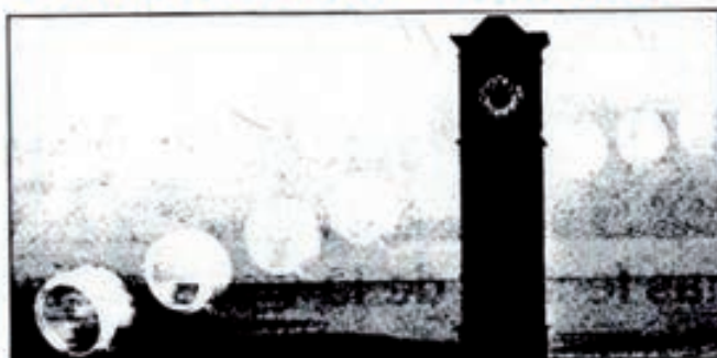
La teoría de la relatividad simbolizada por esta imagen, ha hecho de Einstein un personaje casi mítico.

ello simplemente era necesario postular la existencia de un espacio real, absoluto, fijo e inmóvil, que estaba ocupado por el éter, que servía como sistema de referencia absoluto para los movimientos.