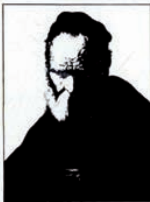
Los filósofos de la antigüedad definían al éter como «el alma del mundo». Para Aristóteles el éter era una quinta sustancia que confería a los cuerpos celestes propiedades distintas.

La necesidad de la existencia del éter había de cobrar fuerza con el desarrollo de la teoría ondulatoria de la luz. Fresnel (1788 - 1827) afirma que si la luz está constituida por ondas, es necesario aceptar que el espacio está lleno con algo que pueda transportarlas, de la misma manera que el agua de un estanque transporta las ondas que se transmiten en su superficie.