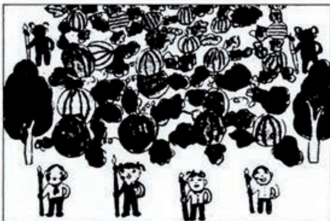
3.—El tercer Cuadro es una exaltación del Trabajo. Los niños de Secundaria pueden opcionalmente consumir parte de su tiempo en el trabajo en fábricas o el campo, en defensa del patrimonio público.