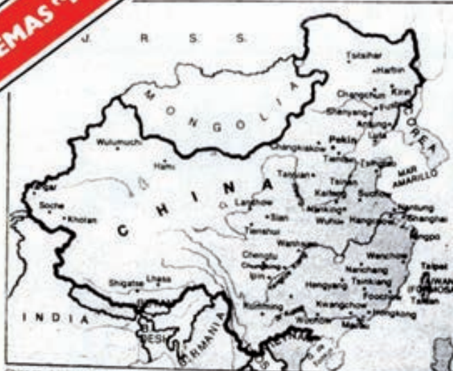
China es un inmenso país que tiene una extensión casi igual que la de toda Europa y una población que se acerca progresivamente al doble.