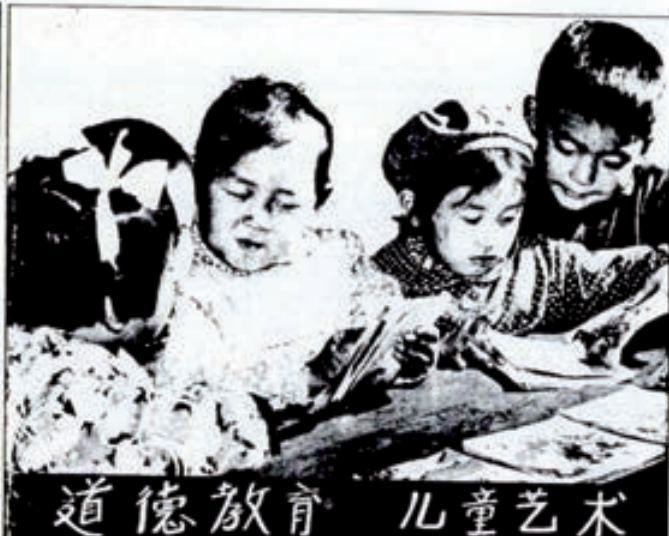
La alfabetización total del país ha sido uno de los objetivos principales de la política interior. Los jóvenes representan más del 60% de la población.