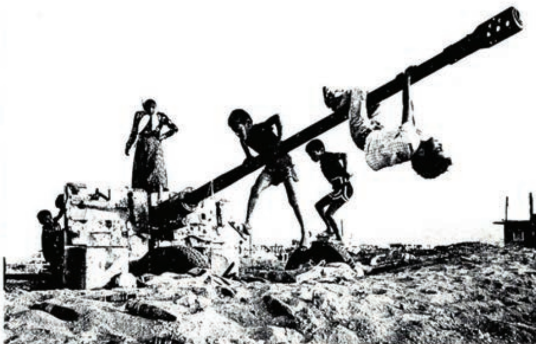
La infancia de los niños libaneses transcurre entre las armas que unas veces matan y otras se convierten irónicamente en juguetes

Clarificar un poco todo el panorama, aunque sea corriendo el riesgo de simplificar un poco las cosas, es lo que se intenta con esta presentación. A ver si hay suerte y al final estamos en disposición de poder seguir mejor el desarrollo de los acontecimientos.