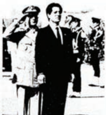
El presidente, Amin Gemayel

A pesar de todos los peligros que minaban su base social el Líbano se constituye desde su independencia en 1944 como una nación próspera y pujante, hasta que los refugiados palestinos y el apoyo incondicional que todo el mundo árabe le ha prestado pusieron en contingencia el equilibrio social conseguido. ¿Sobre qué bases se fundamentó esta estabilidad política y social?