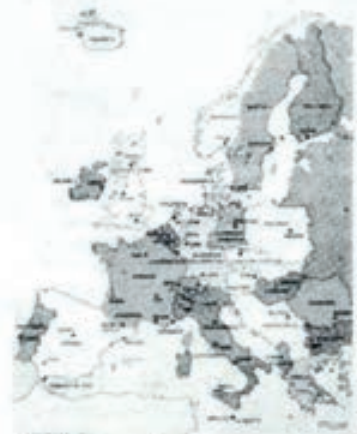
El Mercado Común Europeo es una de las tres grandes potencias económicas mundiales. Representa un proceso de fusión de las economías nacionales de diez países, con una superficie de 1.657.000 km 2 y una población global de 270.000.000 de habitantes.

En marzo de 1957 se firmó en Roma el tratado por el que se creaba la Comunidad Económica Europea. De él surgió la llamada «Europa de los Seis», puesto que seis eran los países miembros firmantes: Alemania, Francia, Bélgica, Holanda, Italia y Luxemburgo. Había comenzado el diseño de la Europa del futuro, pero los rasgos que entonces aparecían más o menos nítidos, se han afianzado unos, borrado otros, cambiado mucho. Ha quedado claro que el proyecto europeo es una tarea histórica, larga y difícil por la que van a tener que trabajar mucho tiempo los estados y las personas. La base, y algo más que la base ha sido puesta; hace falta ahora levantar poco a poco el edificio, con especial cuidado de que no vaya a derrumbarse.