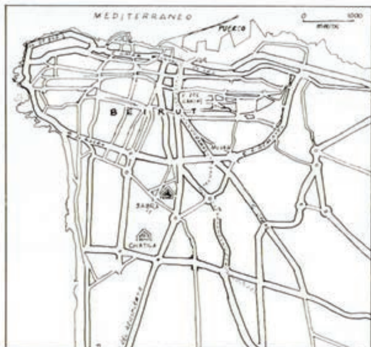
El plano de la ciudad muestra la línea divisoria (punteada), entre la ciudad musulmana y la cristiana. También están señalados los campos de refugiados de Sabra y Chatila donde tuvo lugar la masacre de mujeres y niños que el año pasado conmovió al mundo.