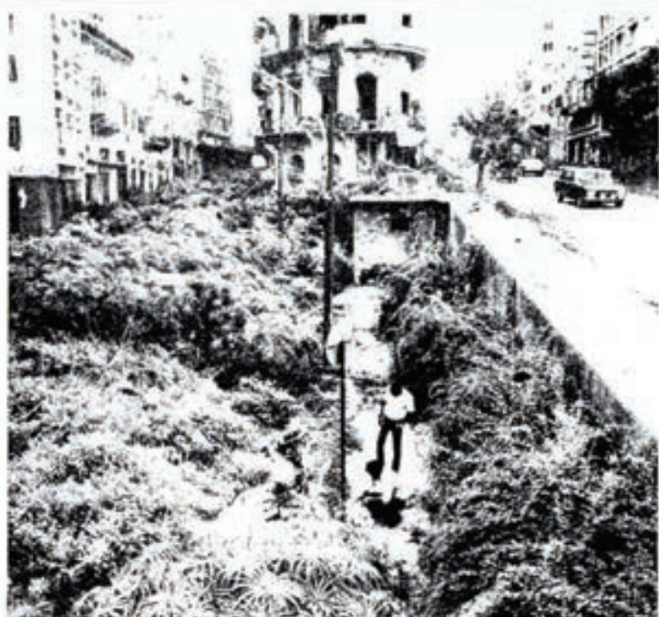
Los matorrales crecen espesos en la calzada denunciando la imposibilidad de transitar por la zona de nadie que marca la frontera entre la ciudad cristiana y la musulmana. La denominada «línea verde» se convirtió, efectivamente, en un jardín salvaje.