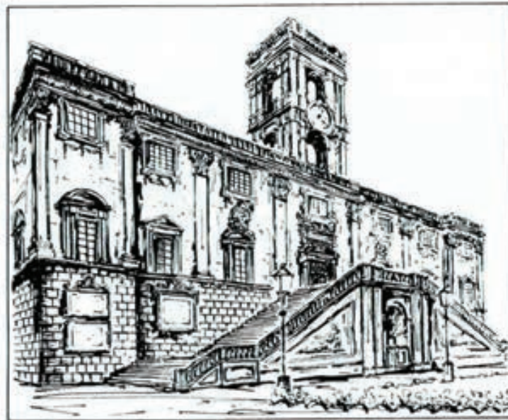
Palacio del Capitolio de Roma, donde el 25 de marzo de 1957 se firmó el Tratado del Mercado Común.

El funcionamiento de la Comunidad Europea. Cuatro instituciones gobiernan la Comunidad: dos centros de decisión: el Consejo de Ministros y la Comisión y dos centros de control: el Tribunal de Justicia y el Parlamento europeo.