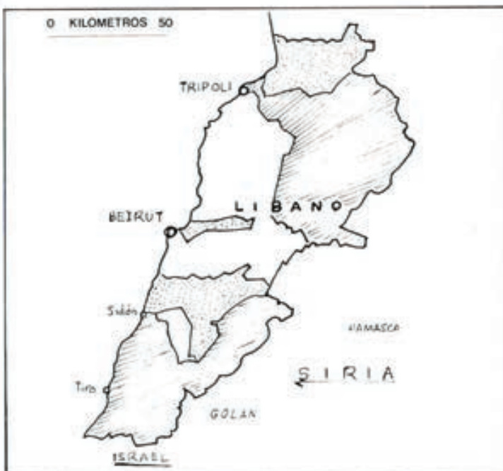
Este mapa representa la implantación de las dos religiones, cristiana y musulmana, en vísperas de los comienzos de la guerra (1975). Las zonas sombreadas son de implantación musulmana. En las zonas