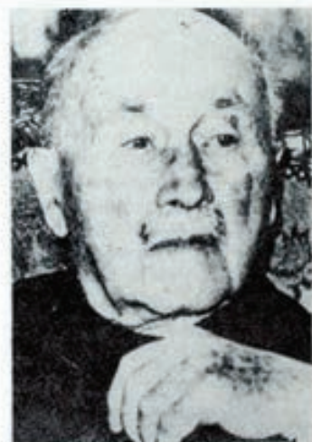
Haec tres años falleció Jean Monnet, el político francés que dedicó toda su vida a la idea de la unidad europea. En el orden económico impulsó los siguientes principios: libre circulación de personas, libre establecimiento, libre prestación de servicios y libre circulación del dinero.

2. En la literatura existe una amplia conformidad sobre los rasgos que diferencian el occidental europeo del oriente asiático. Consulta los libros de texto, piensa sobre ello y haz una redacción o guión de discusión. Es un buen trabajo para conocer nuestra propia identidad: ¿Cuáles son esos