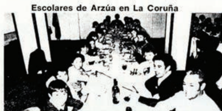
El pasado jueves estudiantes, padres y profesores del colegio municipal de Arzúa se desplazaron a La Coruña dentro del programa de visitas de «La Voz de la Escuela». En la foto, un momento de la comida.

4. Finalmente, compeltad el cuadro adjunto sobre actividades que se pueden hacer en cada área, reuniéndolos previamente los diversos profesores de un mismo curso o nivel, juntando a los alumnos en un mismo trabajo y siendo dirigidos por todos los profesores conjuntamente. Luego, autoevaluad vuestro trabajo en común, en cuanto a contenidos, actitudes y, desde luego, progreso en el mismo equipo de profesores.