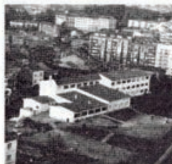
Instituto Eduardo Pondal, fundado en 1978