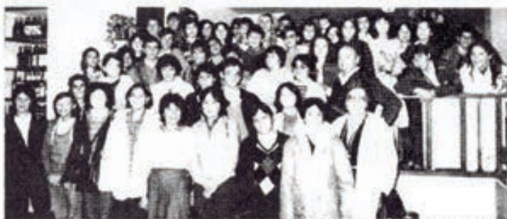
La expedición compostelana, a su llegada al restaurante «La Península» con buen apetito después de una apretada mañana de visitas.

Tras la visita a la oficina principal del Banco de Bilbao en La Coruña, entidad patrocinadora de todo el programa, y a la redacción y talleres de nuestro periódico, comieron en un céntrico restaurante. Por la tarde, tras un recorrido por la ciudad, visitaron «Padres y Maestros» y entregaron, al equipo de redacción de «La Voz de la Escuela» las colaboraciones de maestros y alumnos que ocupan hoy esta página.