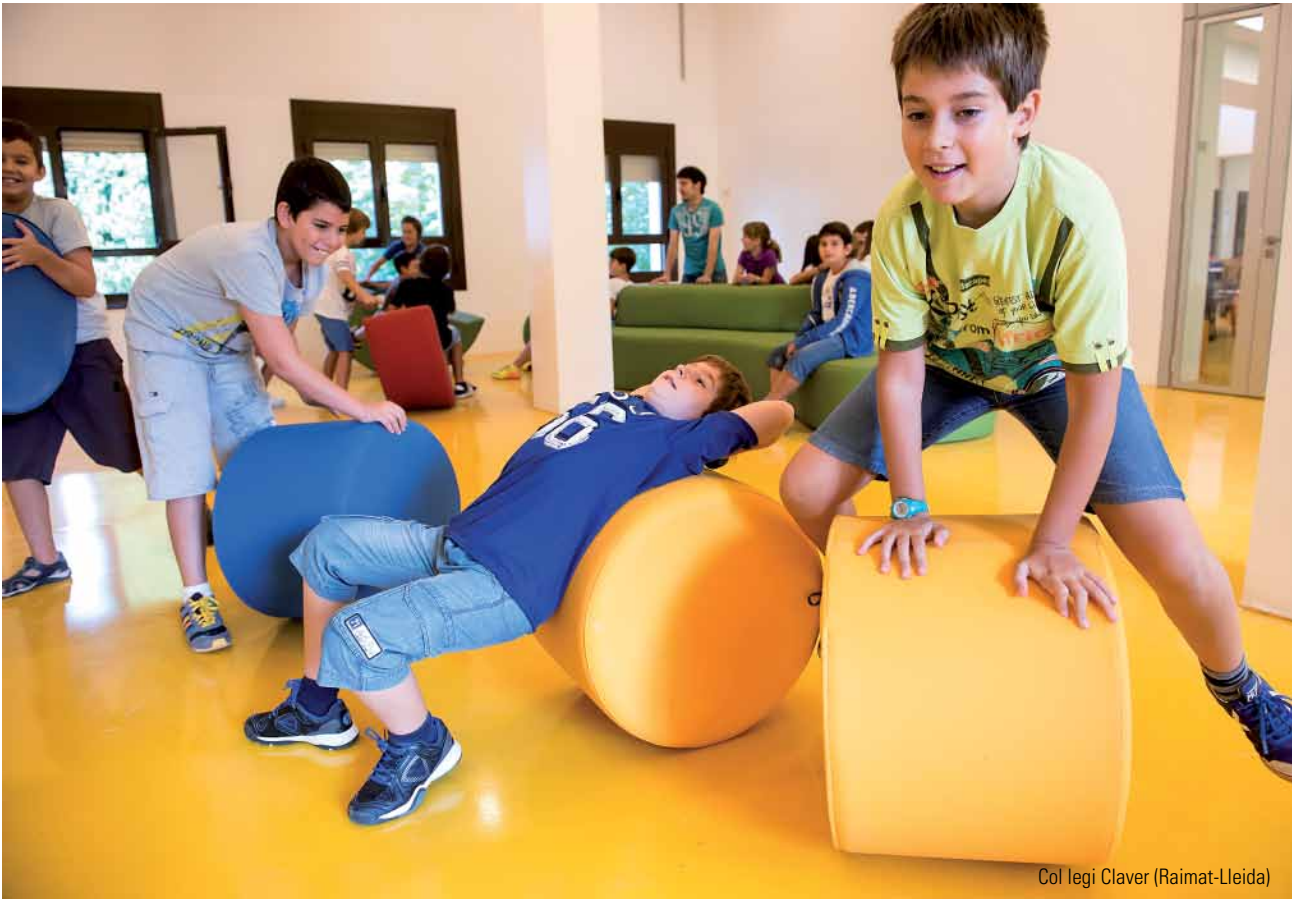
Col legi Claver (Raimat-Lleida)