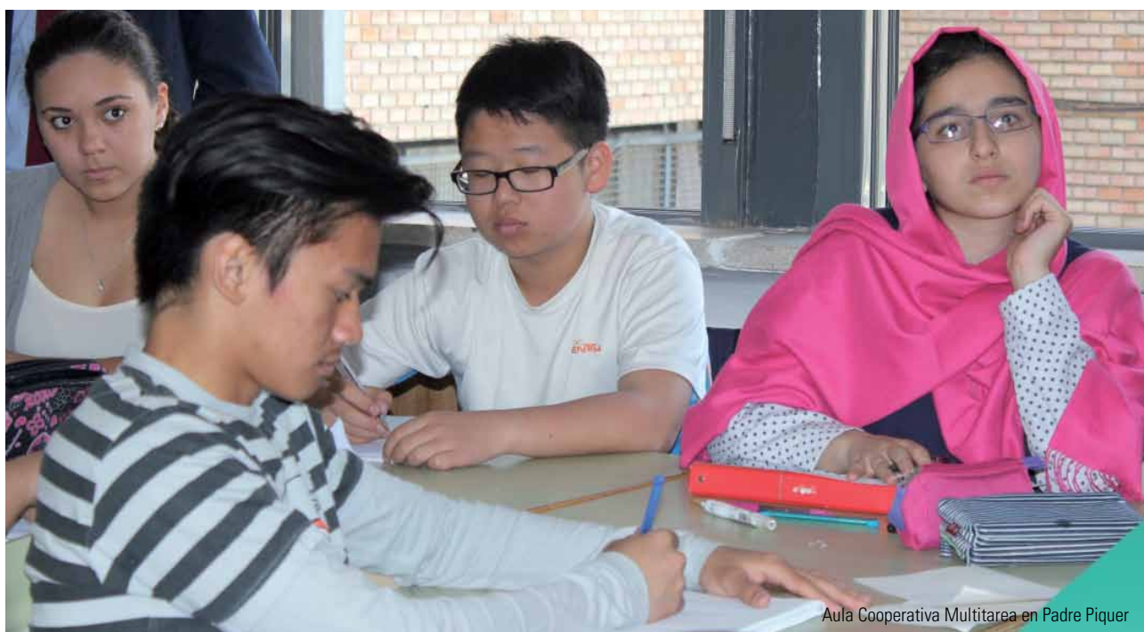
Aula Cooperativa Multitarea en Padre Piquer

¿Cómo cambiar el mundo desde la educación?