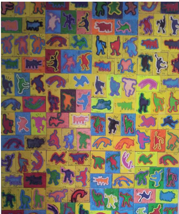
▲ Versión de Keith Haring

Como todo centro educativo, este curso académico nos hemos visto envueltos en un proceso de cambio surgido a raíz de la implantación de la nueva normativa legislativa, tanto a nivel nacional como regional.