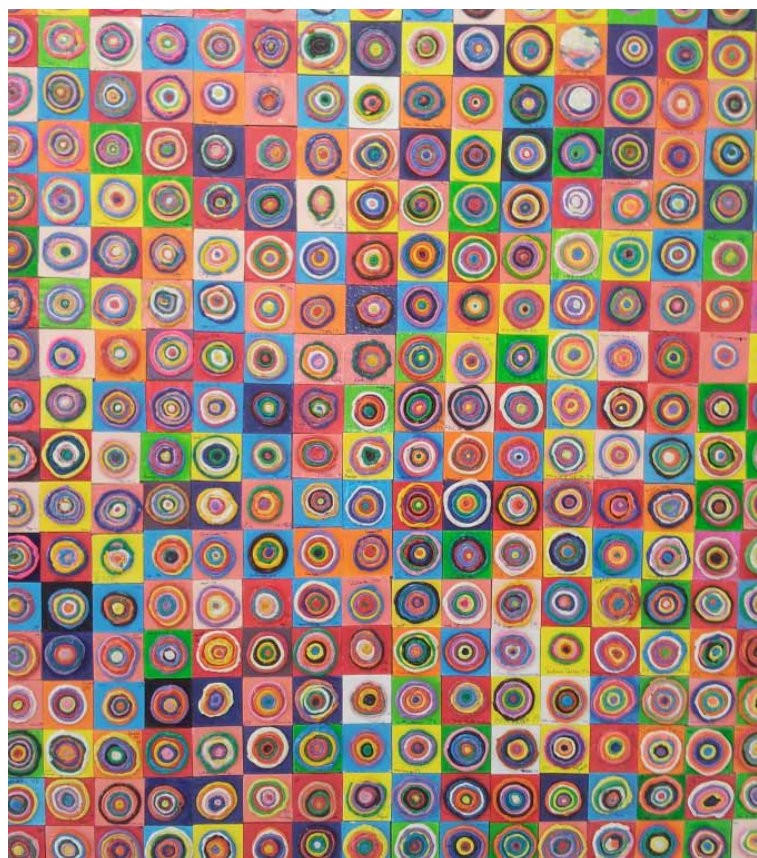
▲ Versión de kandinsky (círculos concéntricos)

Para finalizar, señalar que en este proyecto se trabajará las aportaciones del teatro a las emociones, a través de la elaboración de los diferentes elementos como la representación, trabajando su vocabulario, los diferentes personajes que pueden participar, la expresión corporal. Nos basaremos en el trabajo de grandes personajes del teatro de las emociones, Charlot, Charlie Rivel y Marcel Marceau. Y se elaborará un libro de las emociones, El emocionario •