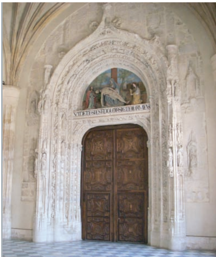
▲ Monasterio de El Paular.

comenzar las clases, cada maestro proporcionaba a las pequeñas agrupaciones de alumnos una tarea acorde a una asignatura concreta, en este caso Matemáticas, Lengua y Conocimiento del Medio. Los niños rotaban por las mesas de forma que todos completaron las actividades propuestas. Al inicio de cada ejercicio, los estudiantes llevaban a cabo una lectura silenciosa de forma individual para conocer y distinguir los objetivos planteados. A continuación, por parejas comentaban los posibles planteamientos y sucesivamente los compartían con el resto del grupo. Finalmente formulaban una solución conjunta y presentaban el resultado a sus profesores.