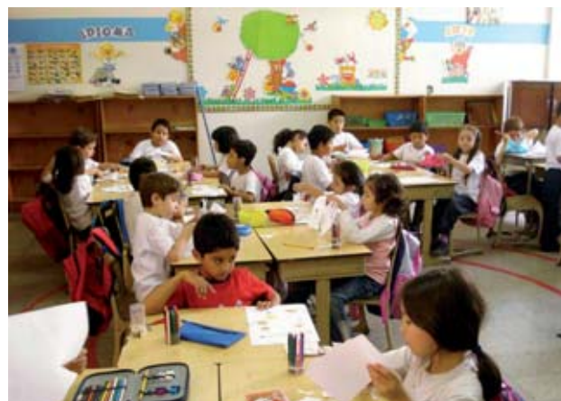
Liceo Javier. Guatemala.