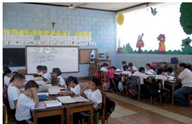
Instituto San José. El Progreso. Yoro. Honduras.