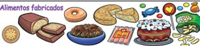
Lámina gigante: «aprendemos a comer».