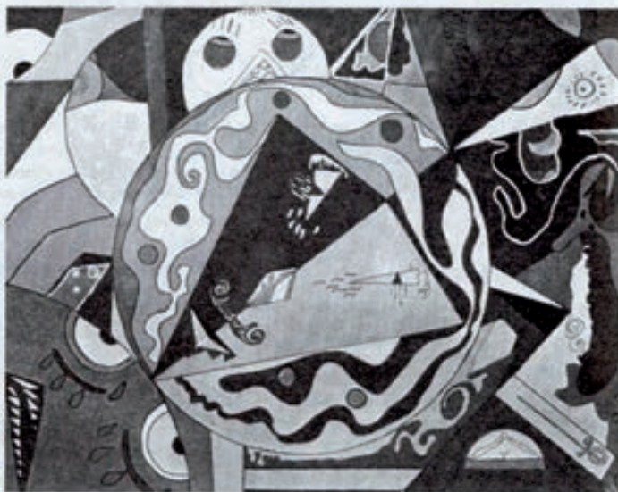
Le lion de l'espace, Dominique (6.º)