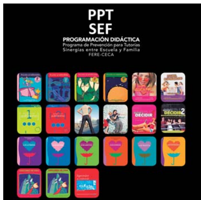
Materiales del Programa de Inteligencia Emocional de Escuelas Católicas.